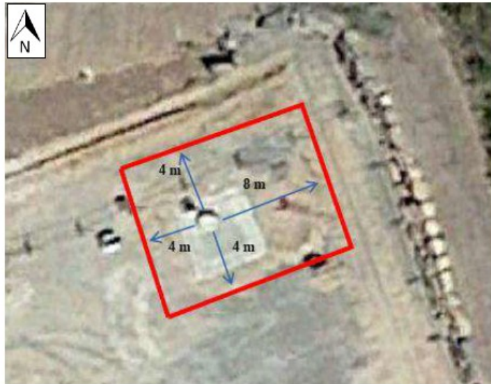
Localisation de la zone de protection immédiate (Vue aérienne)