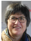
Chef de service