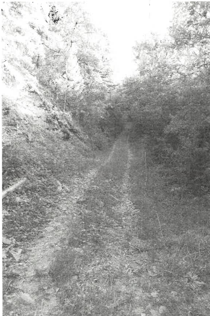
Photo du chemin le 14 07 2022

A handwritten signature in black ink, consisting of several loops and a long horizontal stroke.