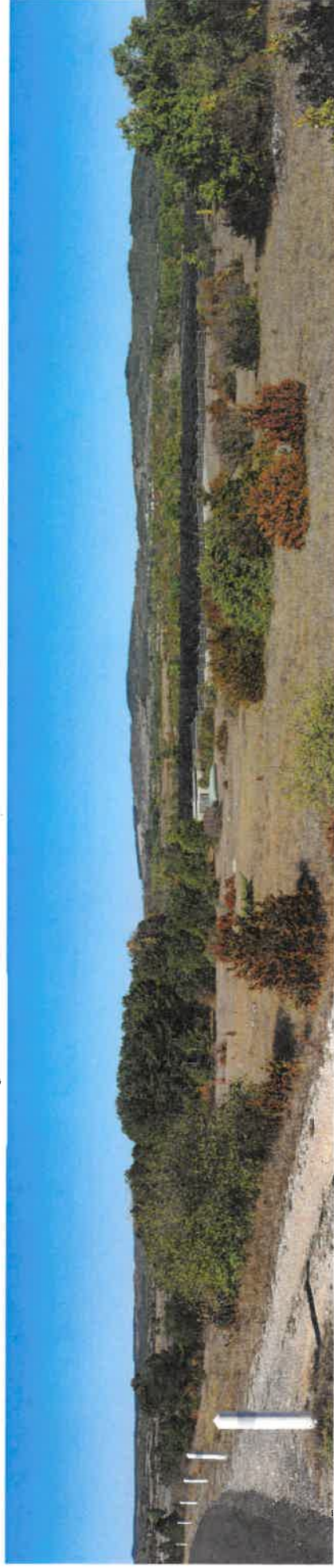
Vue de la RD7 - Projet à court terme