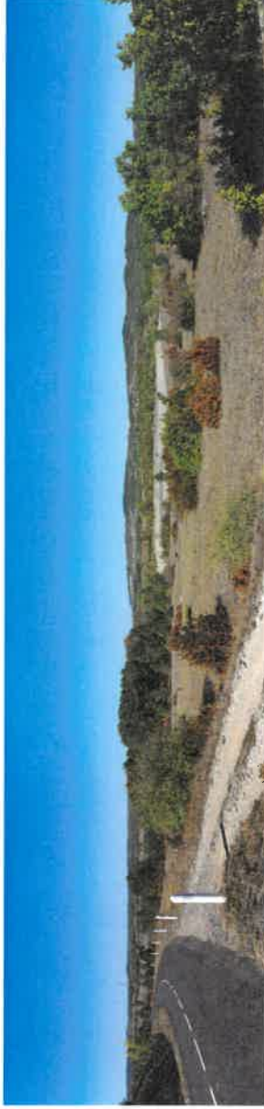
Vue de la RD7 - Etat des lieux

c) Un document graphique permettant d'apprécier l'insertion du projet de construction par rapport aux constructions avoisinantes et aux paysages, son impact visuel ainsi que le traitement des accès et du terrain :