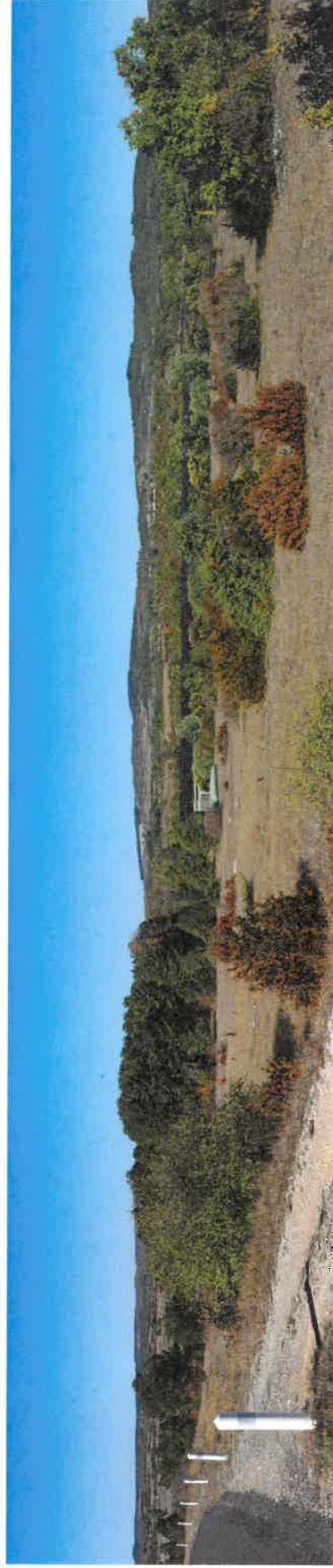
Vue de la RD7 - Projet à long terme