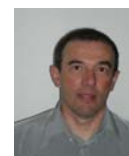
Christian BRUGIE Agence sud

Les agences territoriales relaient les actions des services techniques du siège de la DDT auprès du public, des gestionnaires du territoire, et bien sûr des élus.