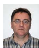
Raymond LAURENS Agence centre